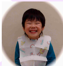
Berry Dental Clinic 院長