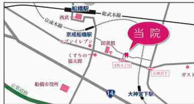
京成船橋駅から徒歩6分、JR船橋駅南口から徒歩7分 大神宮下駅から徒歩5分

滅菌消毒システムに小型高圧蒸気滅菌器のヨーロッパ基準 (EN13060) の設備、そして今まで歯科で使用されている滅菌器よりもさらに厳しく、医科で使用されている大型滅菌器の規格 (EN285) に準じた設備を整え、患者様の治療を最大限に安全に行えるよう対応させていただいております。